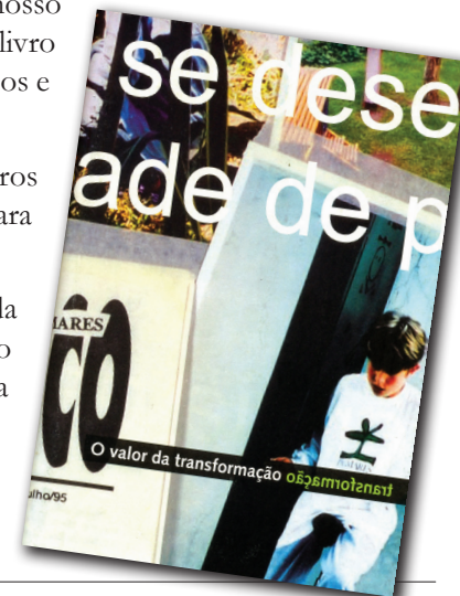
Emília e Yara

Os interessados podem solicitar gratuitamente na secretaria da escola; será um prazer para nós que vocês o conheçam.