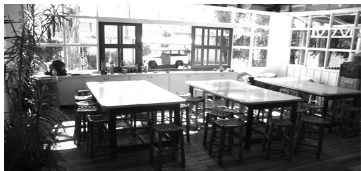
Nova sala de artes