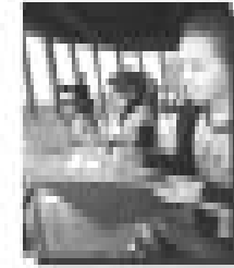
Passeio pesquisa da turma do 4º ano à Torre da Telepar.

Sempre que possível, criamos a oportunidade de diferentes passeios para as crianças; quando (quase sempre) são vinculados a conteúdos pedagógicos, nós chamamos de "Passeio pesquisa". Essa atividade é cuidadosamente planejada pela professora e alunos e, na volta, com as informações recolhidas e com um novo "gás", voltam a desenvolver o que vinha sendo discutido no trabalho de sala.