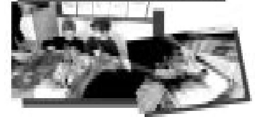
Depois de uma visita à Peixaria, o 1º ano B, com o peixe trazido para ser estudado, fez uma experiência culinária (aqui, as crianças saboreando junto com algumas mães presentes).